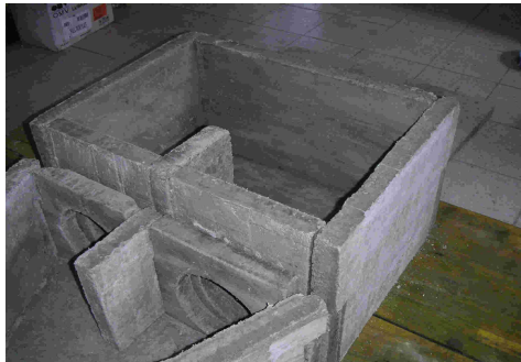
Y und Kessel ohne Deckel (Y teilweise ohne Rückteil und Seitenwand) (Zwischen Y und Kessel haben wir 1m /20cm Betonrohre verlegt)

Die Teile können/sollten sogar innerhalb einer halben Stunde ausgeschalt werden. Die Schalung sollte vor dem Betonieren mit (Schalungs)öl (wir haben gebrauchtes Getriebeöl verwendet) behandelt werden. Die Teile sollte zur Stabilität mit Estrichgitter oder Betonflocken bewehrt werden.